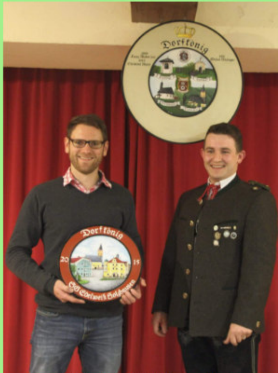
Dorfkönig und Schützenmeister

Mit 50 Teilnehmern brachte der Karlsbach wieder mit Abstand die meisten Leute an den Schießstand. Sie haben sich den Meistpreis redlich verdient. Aber auch Schnalzerverein Holzhausen (25 Teilnehmer) und Trachtenverein Raschenberg Teisendorf (24 Starter) konnten sich über einen Preis freuen.